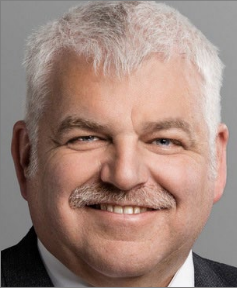
Othmar Reichmuth, Ständerat SZ (pro)